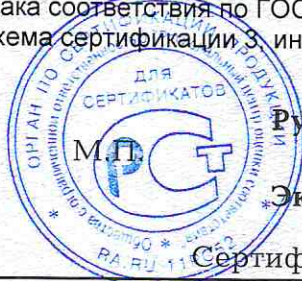
Схема сертификации 3, инспекционный контроль 1 раз в год.

Место нанесения знака соответствия – в товаросопроводительной документации, графическое изображение знака соответствия по ГОСТ Р 50460-92 с надписью «Добровольная сертификация».